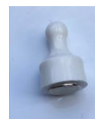
Afbeelding 6. Firefly-sensor (sensorconfiguratie als voorbeeld, uw configuratie kan afwijken)

De FireFly-sensor wordt verzonden in "veilige modus" om de batterij te sparen en verzending tijdens luchtvracht te voorkomen. Laad eerst de batterij op tot 100% (rood indicatielampje op de oplader tijdens het opladen). Reset de FireFly door met de Quantified resetmagneet over de aangegeven plek net boven de connector te vegen. Het LED-lampje zal rood knipperen, als de LED groen knippert is de FireFly online. Zorg ervoor dat de connector altijd is afgeschermd met het eindkapje om corrosie en interne schade te voorkomen